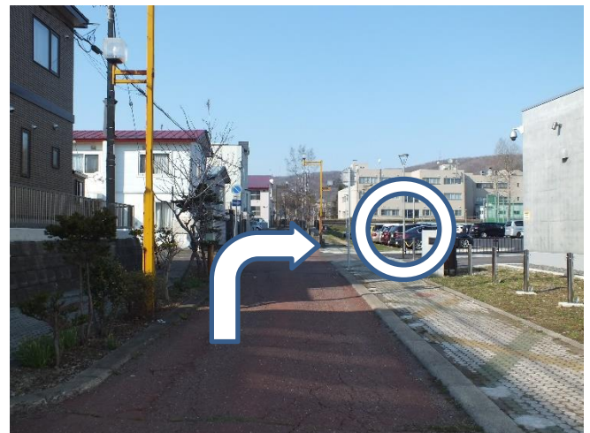
一方通行からの進入にご協力ください