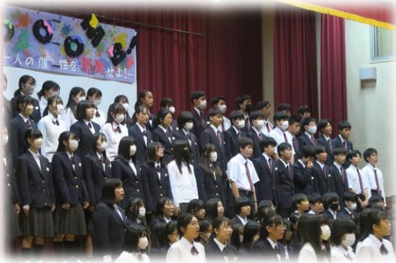
【4年ぶりに復活した全校合唱】

9月21日(木)、保護者や地域の皆様に公開した東明祭が4年ぶりに開催することができました。生徒一人一人が自分の役割を意識しながら、一生懸命本番に向けて練習及び活動を進めることができました。学年、全校、合唱部の発表はとても聴衆の心に響く発表となりました。