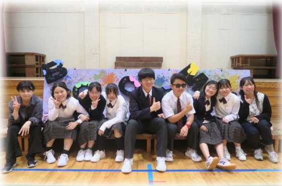
【第57期生徒会のメンバー】

ちぎり絵は「洋画」及びステンドグラスは「ジブリ作品」をモチーフとして、各学級で力を併せて一貼り、一切り心を込めながら作品を仕上げました。今年度も高砂郵便局等で作品を地域の方々にも見ていただく予定です。