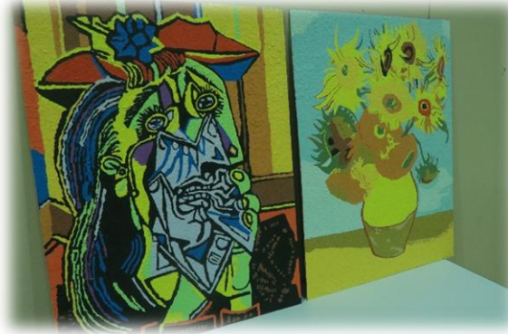
【金賞となった2年2組の作品】

9月21日(木)、保護者や地域の皆様に公開した東明祭が4年ぶりに開催することができました。生徒一人一人が自分の役割を意識しながら、一生懸命本番に向けて練習及び活動を進めることができました。学年、全校、合唱部の発表はとても聴衆の心に響く発表となりました。