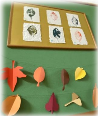
【ほほえみ学級紙工作 葉のスタンピングと紅葉のガーラント】

きた出願手続きについて、各家庭の責任のもと、手続きを進めていかなければならない部分が増えました。手続きの具体について進路通信等で逐次情報提供するとともに、些細なことでも不明な点がありましたら、学級担任または進路担当まで連絡願います。