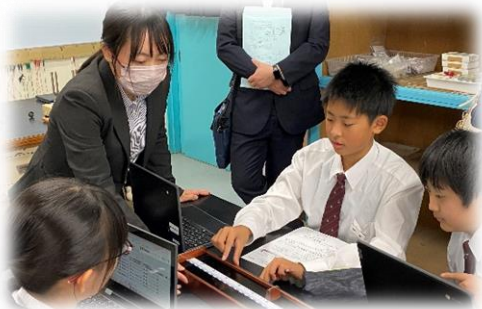
【モノコードを操作し音の変化を確認している様子】

どちらの授業も本時のねらいを達成するために、ICTを文房具の一部として活用する姿が見られました。