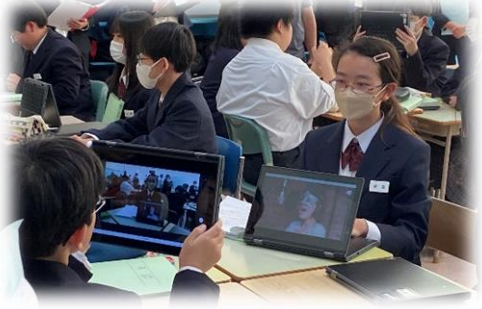
【端末で紹介の様子を動画撮影している様子】