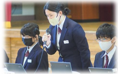
【後期活動計画を説明している様子】

10月31日(火)後期生徒総会が行われました。1人1台端末を活用して、議案書のデータ化を進め生徒達も抵抗なく端末を使いこなしている様子が見られました。