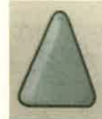
②おにぎりのような形にする。